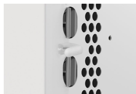
Sensore di temperatura ambiente