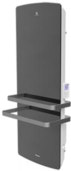
TRP 100 M (verspiegelt)